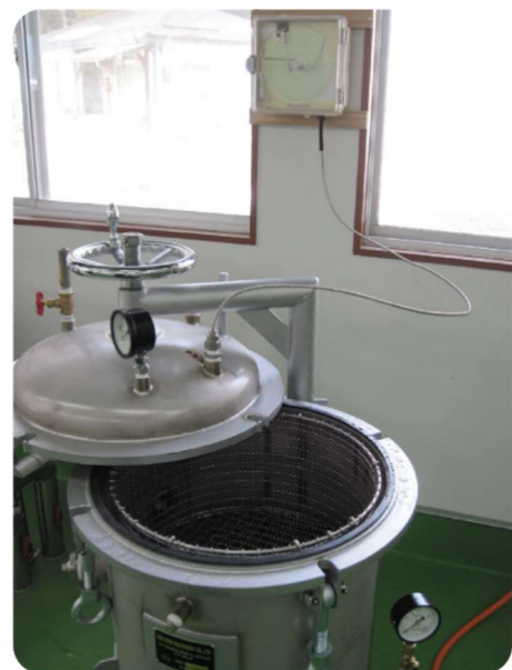
(自記温度計使用例)