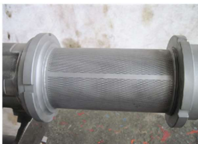
0.5mm φ (一例) ※応相談