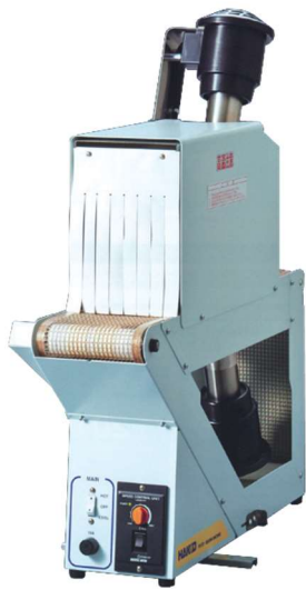
シュリンク フィルム参考