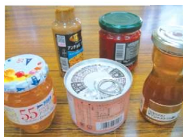
巻き貼りラベル参考

(注) : 缶・びんの表面に凹凸等がある場合 対応できない場合があります。(都度、缶・びんをご提出して頂きます)