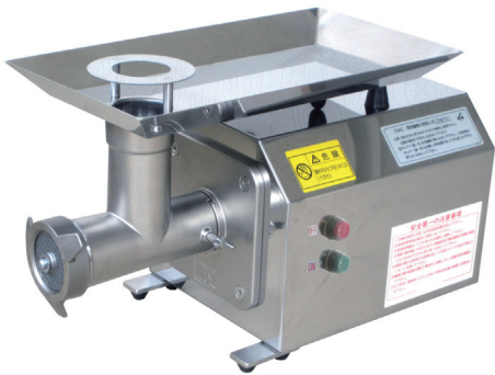
〈写真は 12C2 型〉