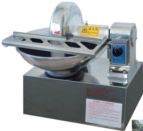
〈写真は 400D 丸刃〉