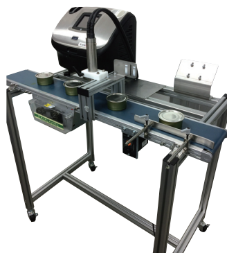
CJ型(缶フタ押印の場合)