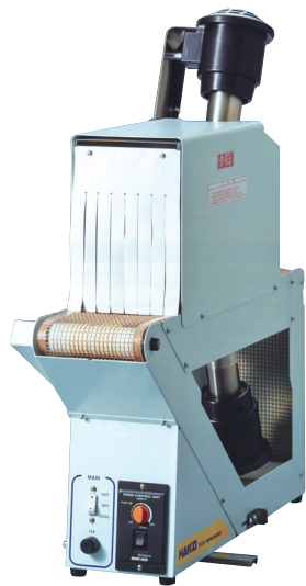
シュリンクフィルム参考