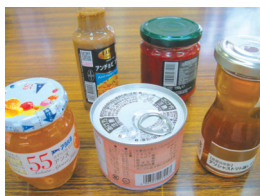
巻き貼りラベル参考